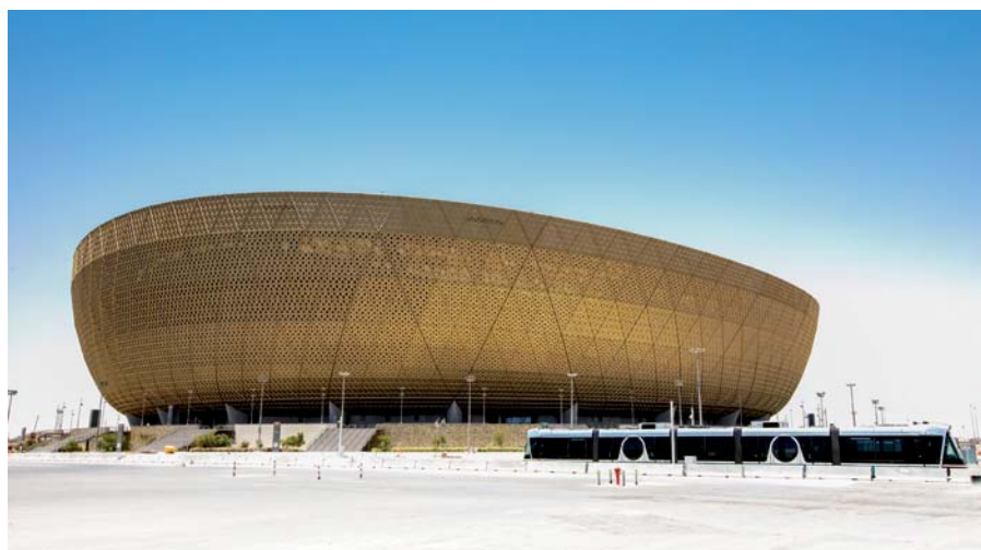
Das Lusail-Stadion mit rund 80.000 Sitzen – hier wird das Finale der FIFA-Weltmeisterschaft Katar 2022 stattfinden.

Mitte der 1990er Jahre begann Katar, das Gas auch zu LNG zu verflüssigen. Seit 2006 ist Katar sogar größter Flüssiggasexporteur der Welt – und das dürfte auch so bleiben, denn das Staatsunternehmen QatarEnergy will seine Verflüssigungs- und Exportkapazitäten aus dem North Field bis 2026 von 77 auf 126 Millionen Tonnen pro Jahr erhöhen.