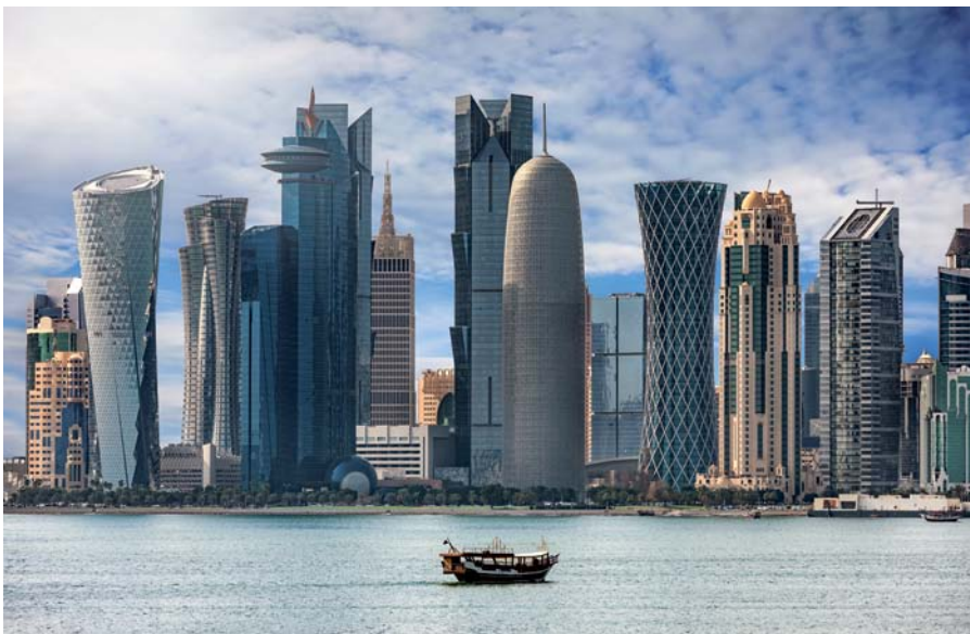
Doha ist die Hauptstadt von Katar und beherbergt den Hamad International Airport, wichtige Teile der Öl- und Fischereiindustrie sowie mit der „Education City“ einen Ort für Forschung und Bildung.

Im Freedom-Index der Organisation Freedom House kommt Katar auf lediglich 25 Punkte, wobei der höchste Wert 100 beträgt. Auf der von den „Reportern ohne Grenzen“ veröffentlichten Rangliste der Pressefreiheit liegt man auf Platz 119 von 180. Interessanterweise ist Katar dennoch die Heimat des journalistisch anspruchsvollen Fernsehsenders Al-Jazeera, der zwar über das eigene Land eher moderat berichtet, sonst aber für eine kritische Berichterstattung aus dem arabischen Raum bekannt ist. Trotz aller politischer Restriktionen ist Katar ein stabiles Land. Ein wichtiger Grund dafür ist wohl der immense Reichtum des Landes: Mit einem Bruttoinlandsprodukt von über 120.000 US-Dollar pro Kopf steht der Wüstenstaat an der Weltspitze.